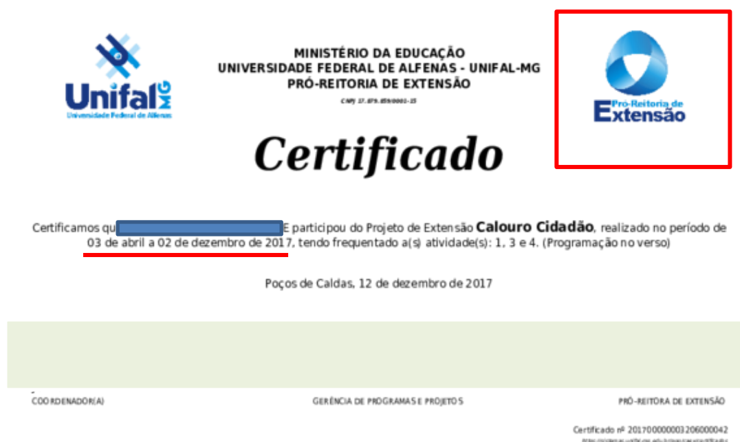
FIGURA 8. Exemplo da comprovação da participação do aluno em um projeto de extensão inserindo a cópia do certificado publicado pela Pró-Reitoria de extensão da Universidade em que o projeto foi desenvolvido.

Para comprovação deve ser anexado ao sistema o certificado de participação do aluno com a carga horária ou período de participação emitido pela Pro-Reitoria de Extensão da Universidade na qual foi realizado o projeto.