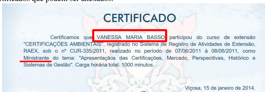
FIGURA 12. Exemplo de um certificado que comprova a atuação como ministrante de uma palestra.

Para comprovação deve ser anexado ao sistema o certificado ou declaração da participação do aluno como palestrante, conferencista, mediador ou debatedor contendo sua forma de participação, nome completo e data do evento. Não há limite de número de certificados que podem ser anexados.