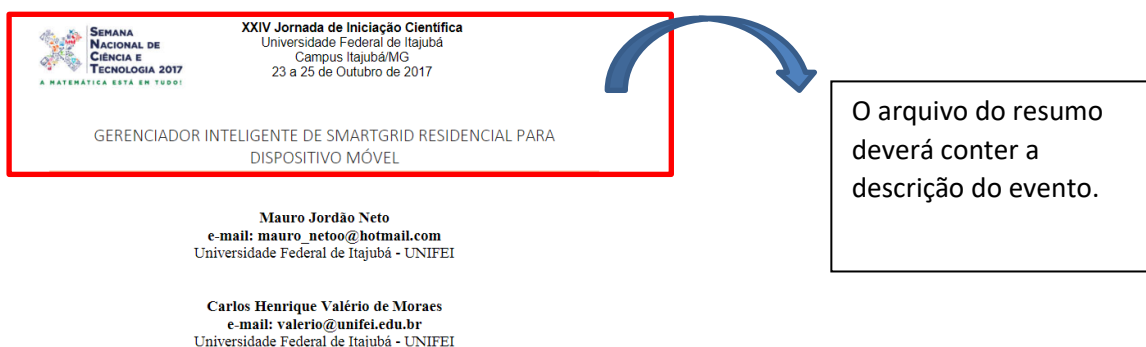
FIGURA 7. Exemplo da comprovação da participação inserindo cópia do resumo publicado pela organização nos anais do evento.