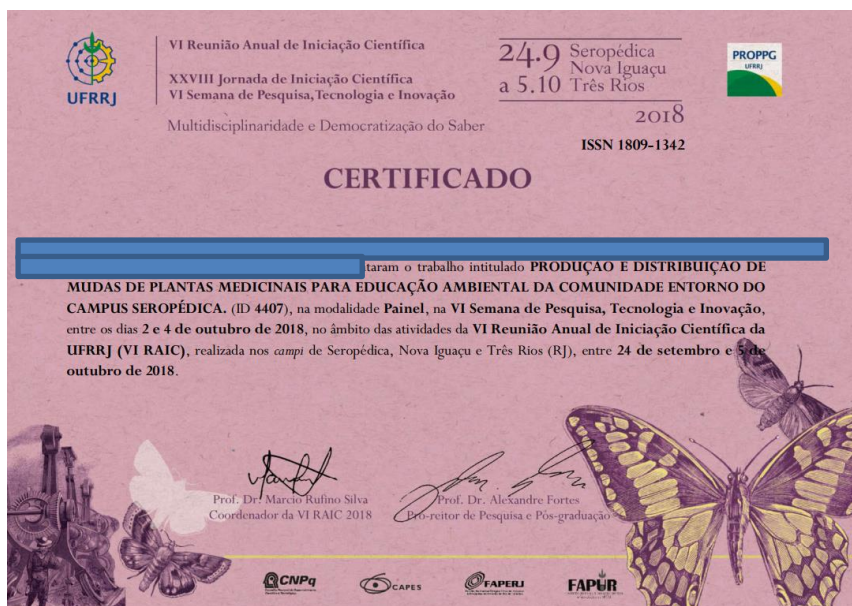
FIGURA 6. Exemplo da comprovação da participação inserindo cópia do certificado publicado pela organização do evento.

Neste item são consideradas as participações do estudante, na condição de autor ou coautor de resumos e demais textos científicos, publicados nos anais de eventos de cunho técnico-científico, tais como: Congressos, Simpósios, Bienais, Jornadas de Iniciação Científica. Para comprovação deverá ser inserido no sistema o certificado de apresentação ou texto oficial publicado pela organização do respectivo evento.