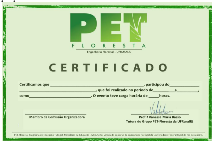
FIGURA 10. Exemplo da comprovação da participação do aluno como ouvinte em um curso ou palestra.

Para comprovação deve ser anexado ao sistema o certificado ou declaração de participação do aluno com nome completo no evento descrito. Não há limite de número de certificados que podem ser anexados.