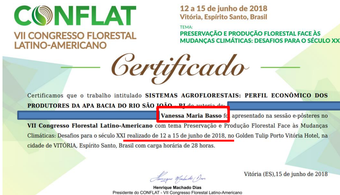
FIGURA 11. Exemplo de certificado da comprovação de apresentação de trabalho em um Congresso.

Para comprovação deve ser anexado ao sistema o certificado ou declaração de apresentação do trabalho pelo aluno com nome completo no evento descrito. Não há limite de número de certificados que podem ser anexados.