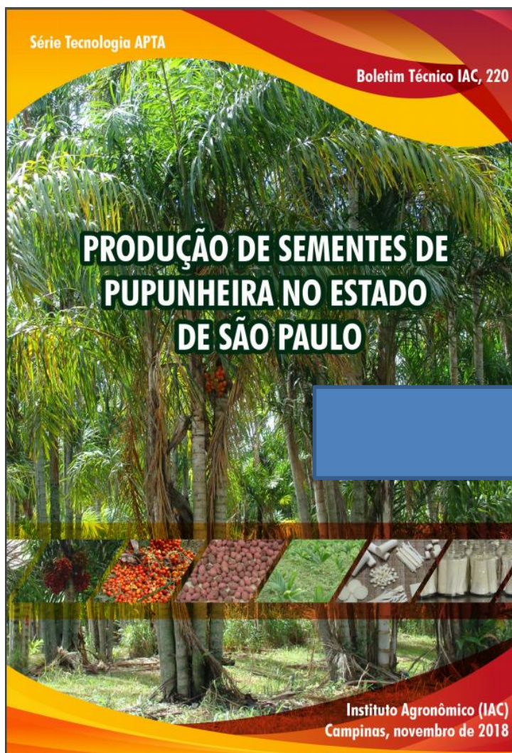
FIGURA 4. Exemplo de um Boletim técnico publicado.

Para comprovação deve ser anexado no sistema o produto obtido desta pesquisa.