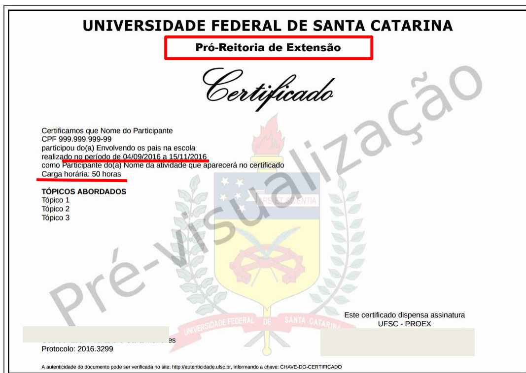
FIGURA 9. Exemplo da comprovação da participação do aluno em um curso de extensão inserindo a cópia do certificado publicado pela Pró-Reitoria de extensão da Universidade em que o projeto foi desenvolvido.