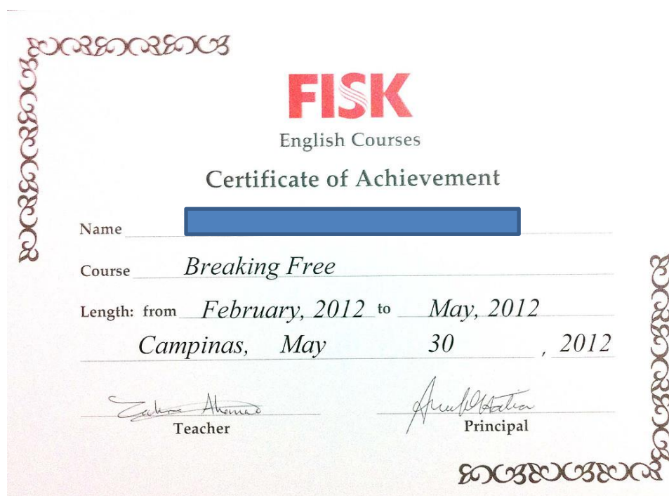
FIGURA 3. Exemplo de certificado para comprovação de curso de língua estrangeira durante um semestre, para contabilização de 20 horas de atividades complementares.

Para comprovação deve ser anexada no sistema a declaração do curso atestando matrícula e aprovação no módulo ou nível no semestre, ou certificado com a carga horária ou período de duração do curso (data). Caso o aluno tenha o certificado com duração de mais de um semestre, o item deverá ser cadastrado duas vezes, sendo anexado o mesmo certificado em cada item.