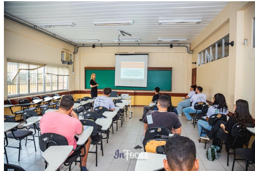
Oficina 2: Faça o seu Plano de Negócios