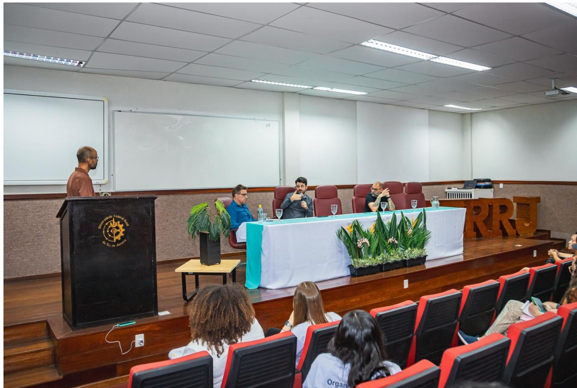
Painel 1: A tríplice hélice como fomentadora da cultura empreendedora