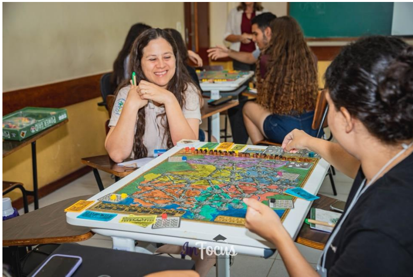
Oficina 1: Pensamento Estratégico