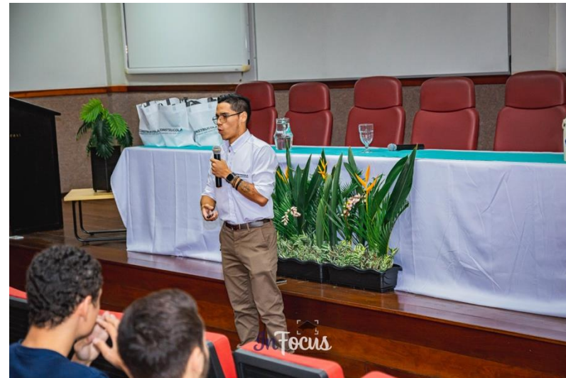
Palestra: A Importância do Empreendedor e do Intraempreendedorismo