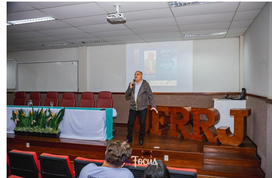
Palestra: Empreendedorismo Digital e Negócios do Futuro