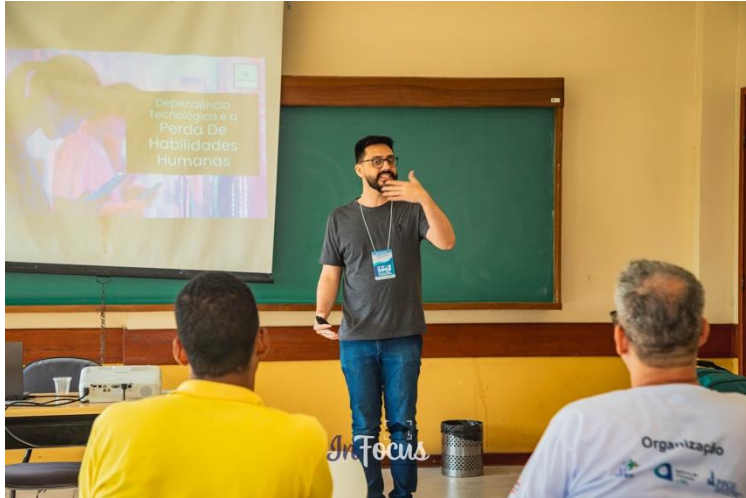
Palestra: IA - Transformando o Futuro Agora