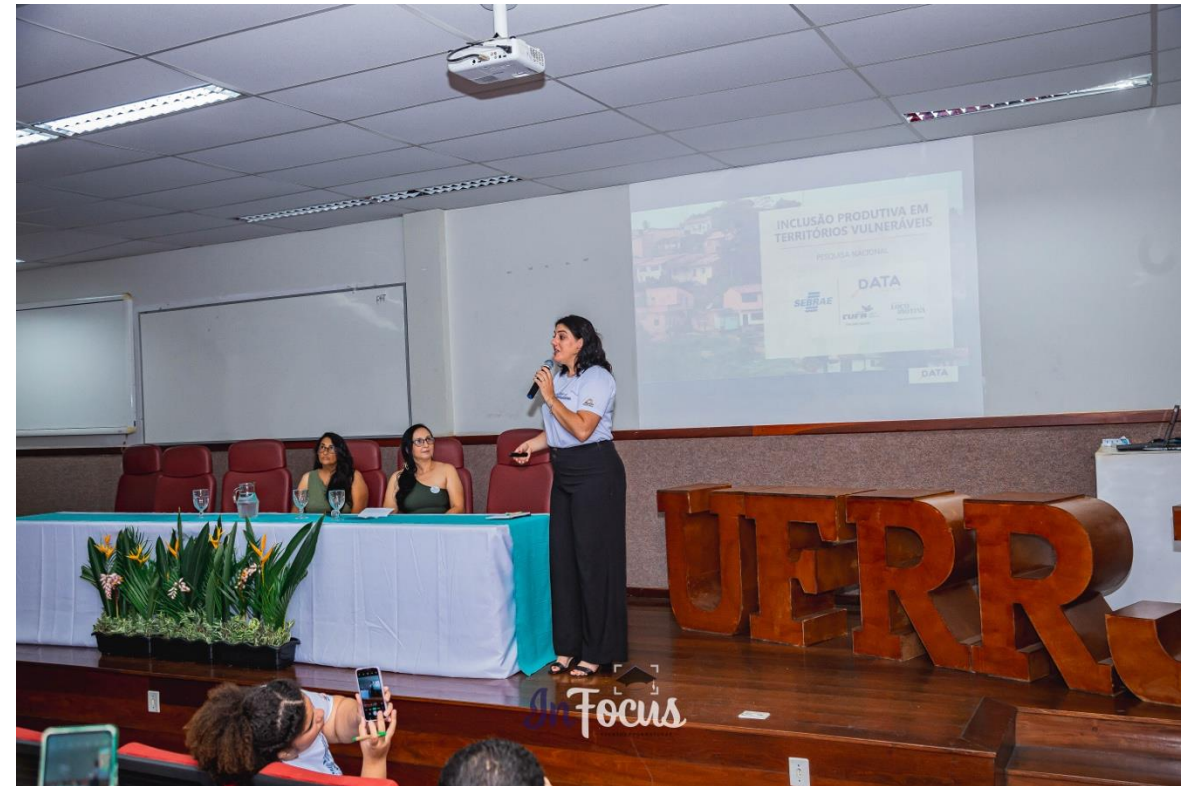
Painel 2 : A potência empreendedora das comunidades do Rio de Janeiro