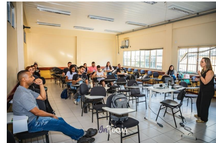
Oficina 3: Pesquisa de Mercado para Empreendedores